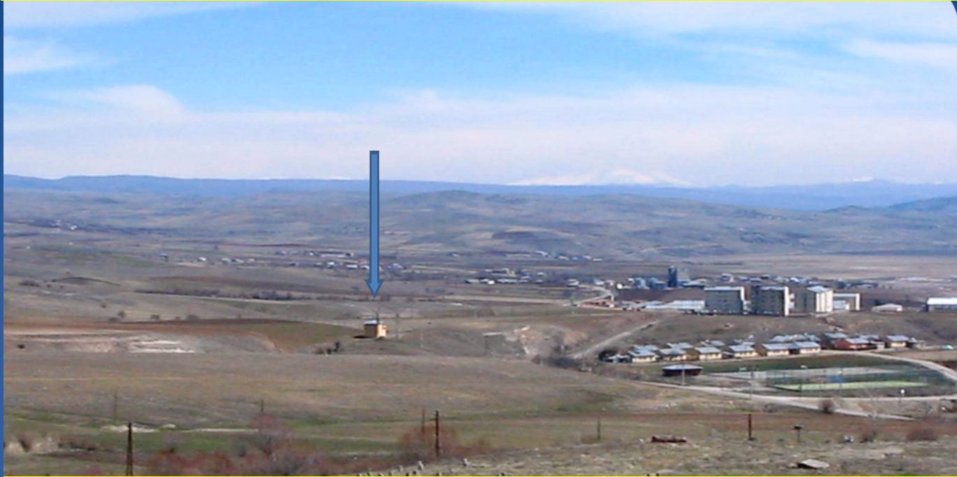
2013 yılında Akpazar-Çarşıbaşı Mahallesi'nin bir kısmı