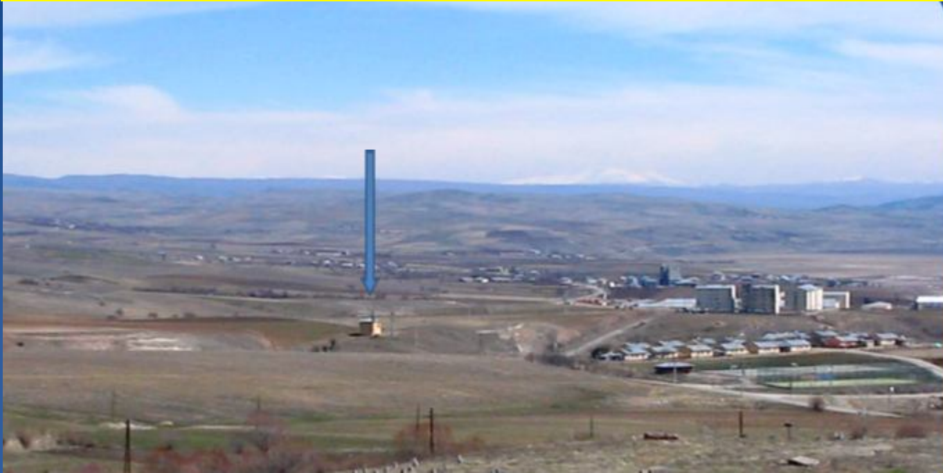
2013 yılında Akpazar-Çarşıbaşı Mahallesi'nin bir kısmı